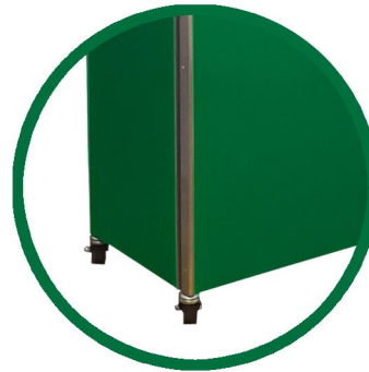
1.- Movilidad AdValue