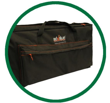
4.- Maleta AdValue