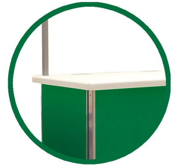
2.- Cubierta AdValue